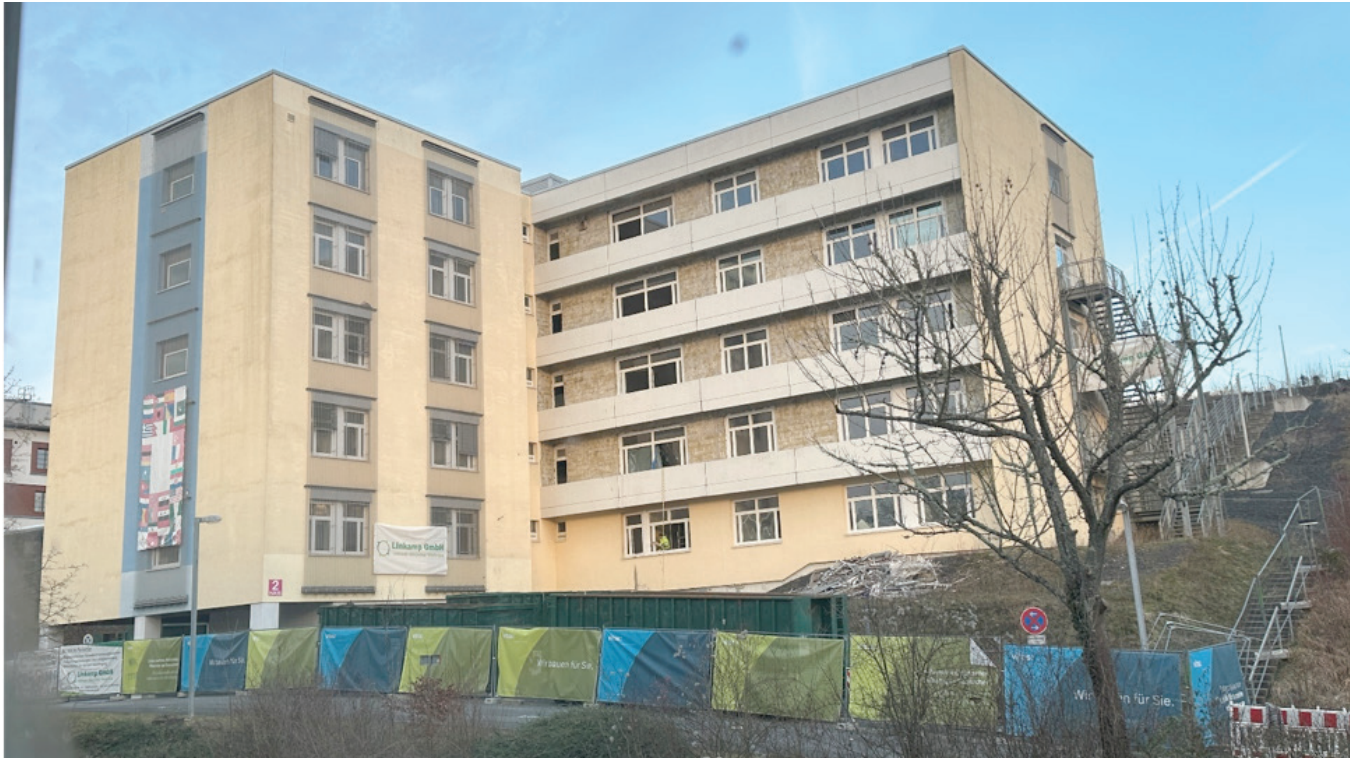
Ehemaliges Klinikgebäude der Vitos Hadamar.

im März 2024 abgeschlossen werden. Im Anschluss daran wurden die baulichen Maßnahmen für den Neubau des Erweiterungstrakts auf der freigeschaffenen Fläche aufgenommen.