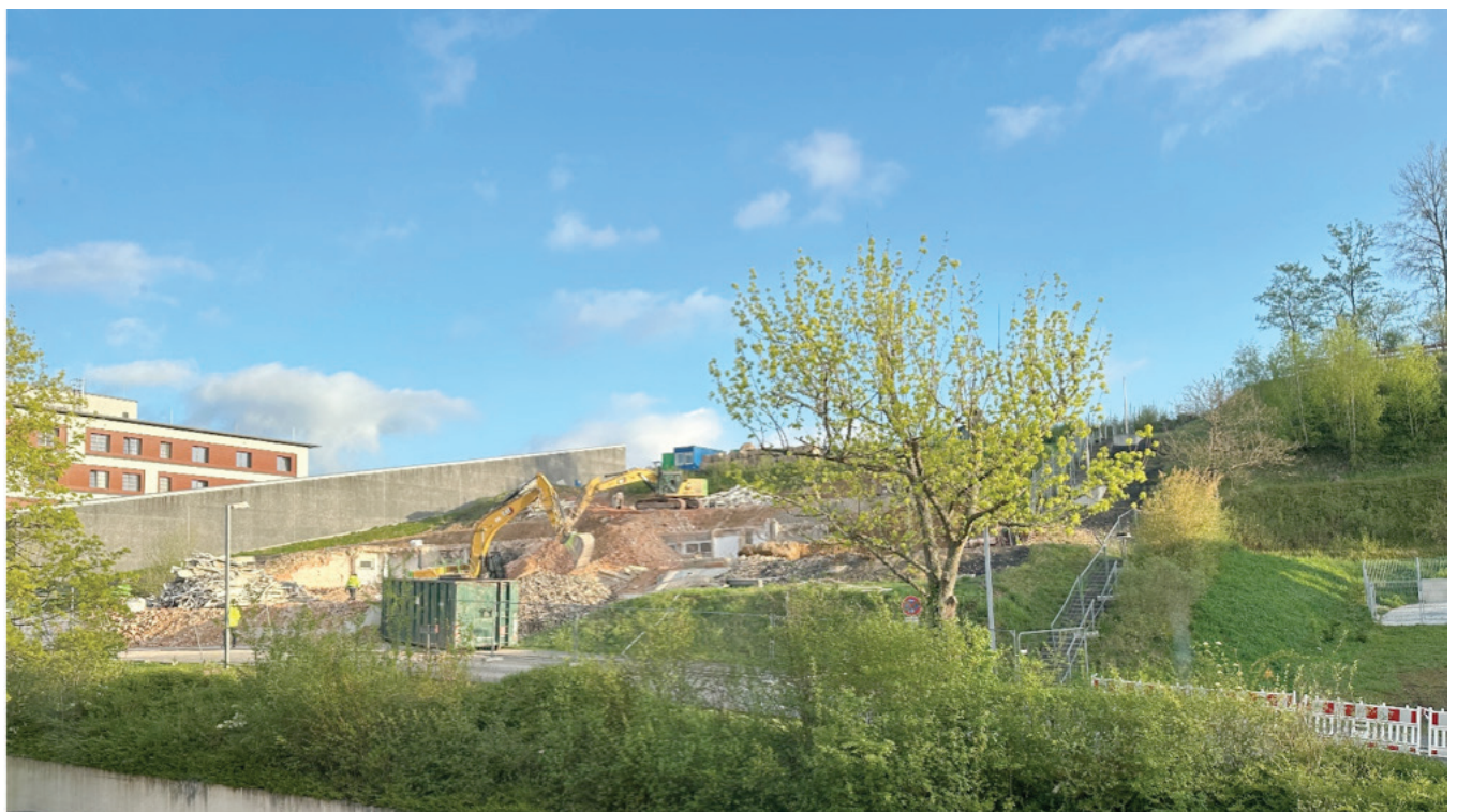
Abrissarbeiten im März 2024.