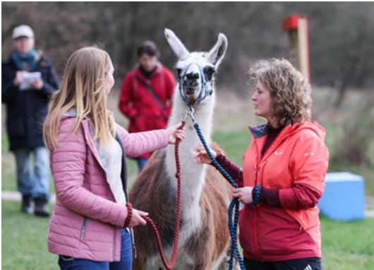
Spaziergang mit Lama: Im Rahmen der tiergestützten Therapie besuchen uns regelmäßig verschiedene tierische Begleiter auf dem Klinikgelände.