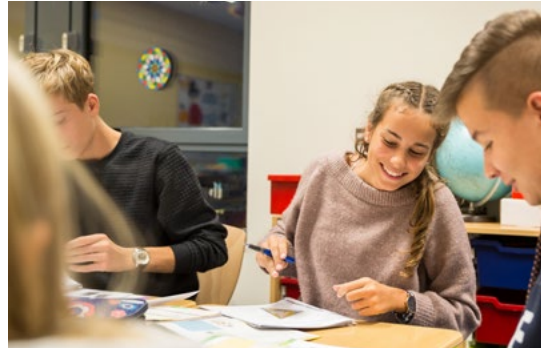
An der Anna-Freud-Schule auf dem Klinikgelände erhalten unsere Patient/-innen während ihres Aufenthalts auch Schulunterricht.